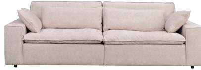
RAWLINS 3-SITSSOFFA MAXI B 259, D 116, H 85, SH 45

Lagerförd art.nr 122642 Bobby beige #2 (TK 2) 20 995:-